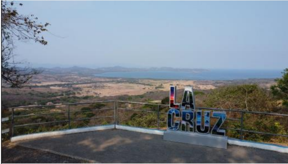
La Cruz, abril 2026