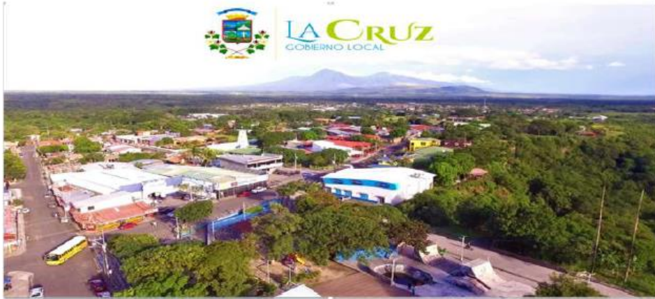
La Cruz, junio 2023